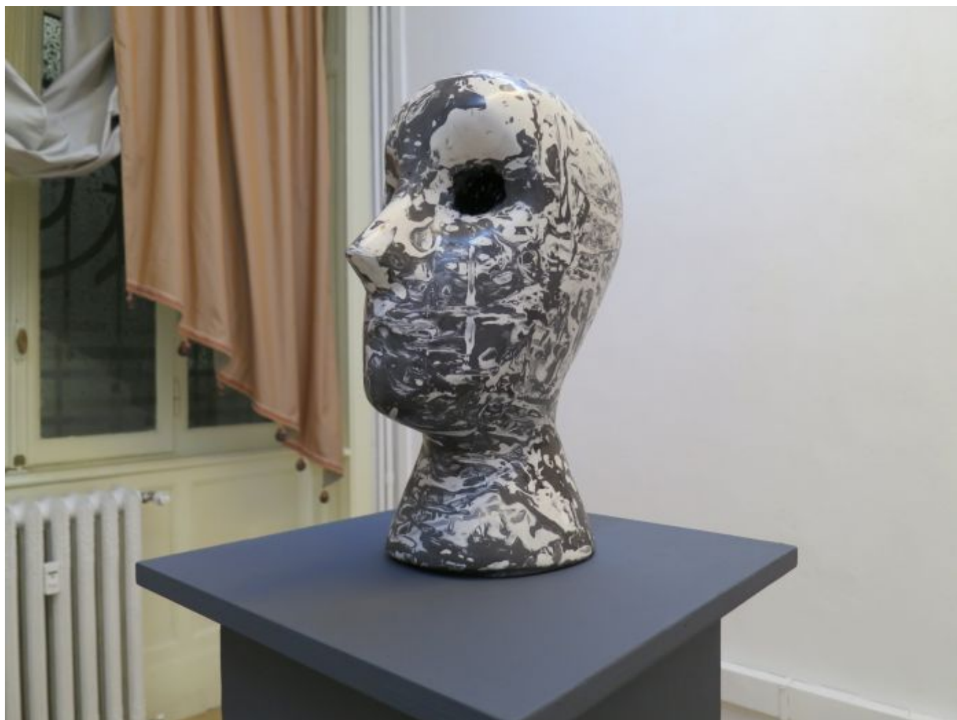
Cleo Fariselli – Calipso - exhibition view at Clima Gallery, Milano 2016

Clima Gallery, Milano – fino al 21 gennaio 2017. Con “Calipso”, l'artista originaria di Cesenatico presenta una personale che introita la gestualità di un precedente percorso performativo all'interno di materia plastica, fittile e bronzea. In tre diverse aree di intervento, il volto dell'uomo è indagato come portatore di uno sguardo che cede il passo alla ricerca dell'alterità.